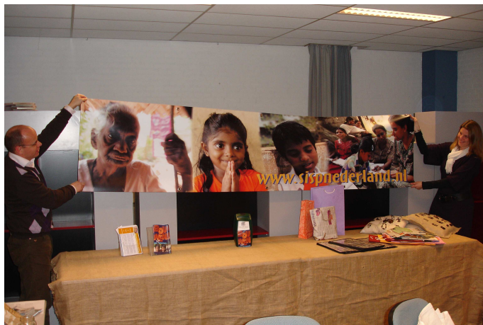
18-12-2008 een start gemaakt door medewerkers van AstraZenica voor een meer professionele outfit voor de SISP marktkraam

Tot nu toe zijn we minder succesvol geweest bij particuliere fondsen. In 2008 zijn er bij 7 particuliere fondsen aanvragen gedaan voor een concreet project. Op dit moment zijn er 5 afwijzingen binnengekomen. Toch zal naast de inkomstenbron uit donateurs en sponsorgelden ook de benodigde gelden bij fondsen geworven dienen te worden.