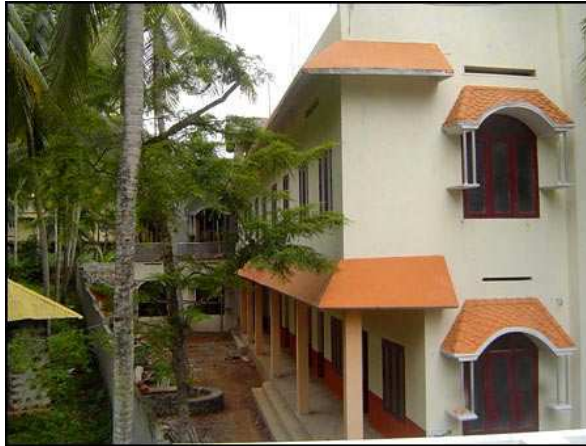
Nieuw free education center; rechts school; vooruit de ateliers