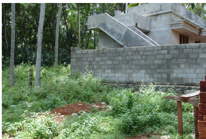
SISP India heeft nog een grote wens om op deze grond uit te breiden.