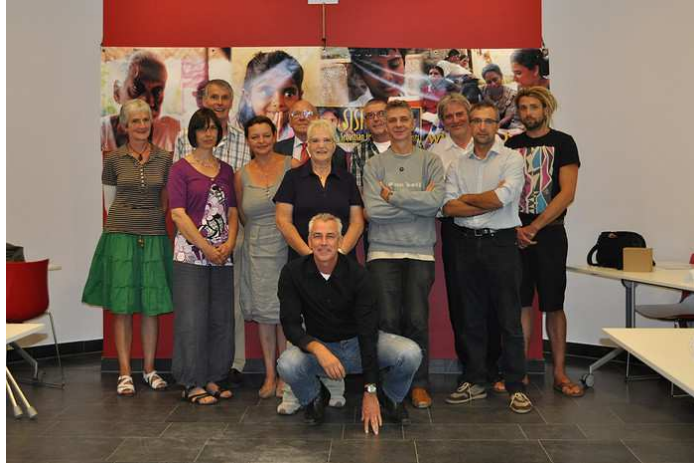
Internationale bijeenkomst donorlanden 11 september 2010 in Mechelen Afvareidigingen uit België, Italië, Nederland en India

Vernieuwing bestuur SISP NL. gerealiseerd